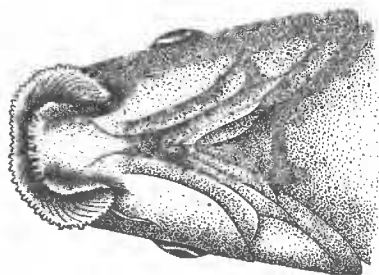
FIG. 3. — Bouche d' Osteochilus branchynotus nov. sp.

Les deux espèces d' Osteochilus dont se rapproche l' O. branchynotus sont à affinités insulindiennes. Le Cyclocheilichthys de